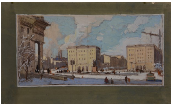
Рис. 2. Театральная площадь. 1962

К старым 1960-м годам относится и акварель «Станция Кедун-Быкова» [4, с. 57], которая располагалась в районе Ключей недалеко от Свято-Троицкой церкви. В 1960-е годы Свято-Троицкая церковь пребывала в разрухе, хотя сами остовы церкви и колокольни были целы. Церковь была отреставрирована уже в начале 2000 годов. Зато тогда в 1960-е в данном районе было много железнодорожных путей, и на завод имени Куйбышева подвозили в вагонах металлургическое сырье для домен. По этим же путям вывозили шлак на открытое производство шлаковой брусчатки. Сегодня на этом месте находится новое здание Тагилэнерго. И так, посередине листа в разные стороны расходятся железнодорожные пути, на которых строях груженные и пустые вагоны. Справа между путей находится будка путейца и около цветочная клумба. Еще правее – розовое здание станции Кедун-Быкова. Отсюда отходила узкоколейка, которая шла до Висимо-Уткинска. В настоящее время пути разобраны. Все мечтают восстановить узкоколейку, но это очень затратное мероприятие, да и некому его содержать.