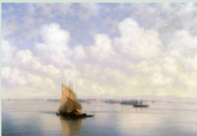
Иван Айвазовский. «Морской пейзаж»