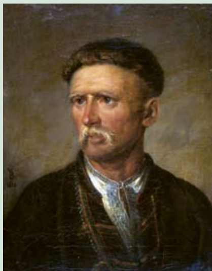
Василий Тропинин. «Устим Кармелюк». 1820 г.

художников, отобранные сотрудниками музея в министерских фондах в 1980-90-е годы. Произведения дореволюционного русского искусства практически с этого времени не поступали в коллекцию музея, хотя необходимо отметить, что, благодаря помощи министра культуры РСФСР Ю.С. Мелентьева (нашего земляка, уральца), в фонды НТМИИ в 1970-80-е годы были переданы портреты П.А. Демидова и Ф.И. Соймонова, относящиеся к XVIII веку, а также картины А. Самохвалова 30-х годов XX века и полотно, приписываемое великому художнику эпохи Возрождения Рафаэлю Санти «Святое семейство»,