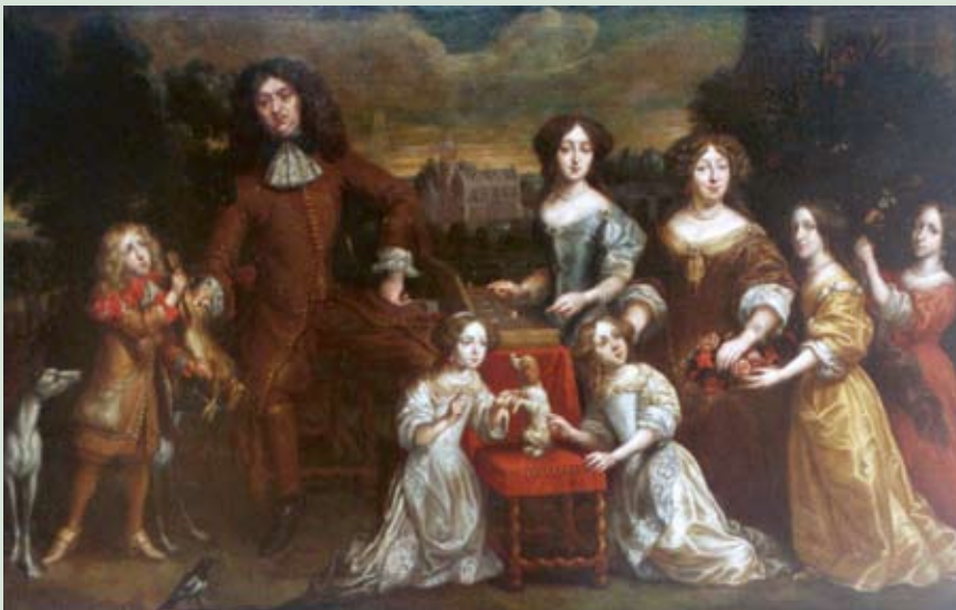
Ян Мейтенс. Семейный портрет. Начало XVIII века

Итак, по инвентарным книгам, в музее в день его открытия числилось 73 картины. Следующее крупное поступление состоялось в 1946 году, когда из управления по делам искусств при СНК РСФСР поступило 102 произведения, среди них: пейзаж «Река Кюмени» П. Верещагина, «Женский портрет» В. Боровиковского, «Город Астрахань» М. Доливо-Добровольского, «Битва под Лейпцигом» Б. Виллевалде, «Морской пейзаж» И. Айвазовского, «Семейный портрет» голландского художника Яна Мейтенса. В 1951 году поступил еще один пейзаж И. Айвазовского, а в 1962-м – «Портрет девочки» К. Лемоха. И уже в 1971 году из фондов министерства культуры РСФСР было большое поступление живописи и графики советских художников.