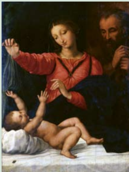
Рафаэль Санти. «Святое семейство». 1509 г.

Третье направление комплектования фондов музея – поиск и приобретение памятников изобразительного искусства дореволюционной России и наследия советских художников до 50-х годов XX века. В московских семьях наследников были приобретены живописные полотна 1920-30-х годов – Александра Шевченко, рисунки и темперы 1910-х годов Зинаиды Серебряковой, гравюры Алексея