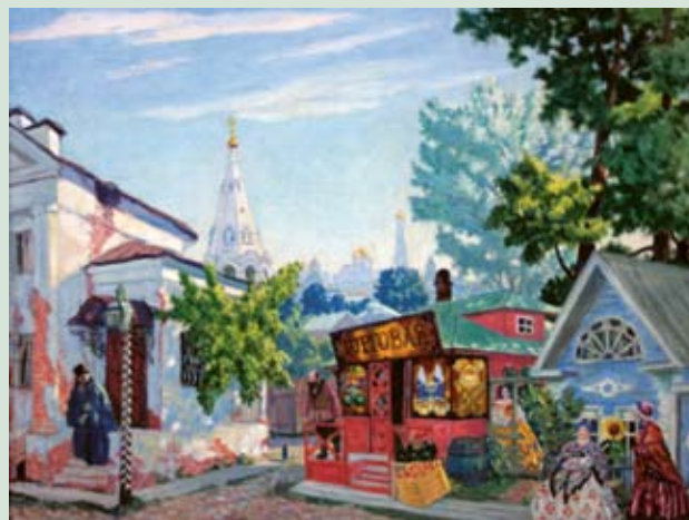
Борис Кустодиев. «Встреча». 1917 г.

Особо следует отметить крупные поступления произведений русских художников из фондов местного краеведческого музея в 1951 и 1959 годах: 116 произведений. Среди них картины В. Аммона, В. Верещагина, В. Боровиковского, В. Раева, И. Айвазовского. Эти работы попали в Нижний Тагил в 1925 году из Государственного музейного фонда. Изучая документы, я установила, что ядро этой группы произведений составили живописные полотна, ранее принадлежавшие знаменитому Румянцевскому музею, расформированному в советское время. Оттуда имеют происхождение пейзажи А. Гине, Н. Бажина. Тогда же поступили картины русского и советского авангарда 1910-1920-х годов XX века: Веры Пестель, Бориса Эндера, Ольги Розановой, Александры Экстер, Николая Синезубова, Аристарха Лентулова. В 1990-е годы многие из этих работ с разными выставками побывали в Германии, Италии, Финляндии, Франции, Испании, Соединенных Штатах Америки, Шотландии, таким образом войдя в научный оборот мирового искусства. Нужно отметить, что такую же богатую выставочную географию имеют многие картины современных