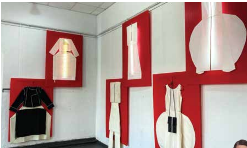
Работы Анны Сергеенко