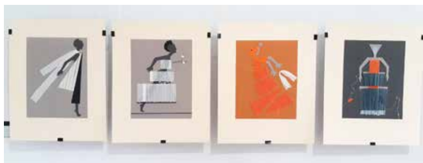
Фрагменты экспозиции «От черного к белому»

цвета как синонима внутренне-го просветления, духовной победы жизни над смертью».