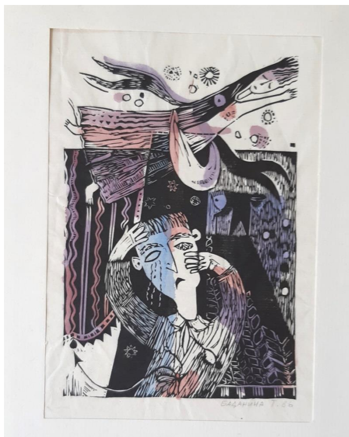
Рис. 2. Баданина Т. В. 1955. Из серии иллюстраций к книге Федерико Гарсиа Лорки «Когда пройдет лет пять». 1986. Бумага, гравюра на пластике, акварель, тушь. Собственность автора

Во время работы над иллюстрациями к сюрреалистической пьесе Ф. Гарсиа Лорки «Пройдет пять лет» (рис. 2) художница отталкивалась от рисунков писателя. Лорка дает точные указания на визуальное и цветовое оформление спектакля и в самом тексте произведения: «Костюм должен быть весьма странного покроя – огромные голубые пуговицы, жилет, кружевное жабо» ; «...комната залита голубым или синим светом» (перевод Н. Малиновской). Оттенки синего, создающие атмосферу ночи, загадки и огромной тоски героя, его пролитых слез, являются неким лейтмотивом текста. Татьяна Баданина использует синий, фиолетовый, сиреневый и противостоящий им желтый как ведущие цвета и в акварельных рисунках к пьесе, и в оттисках, раскрашенных красками. Напечатанные иллюстрации существуют в двух вариантах: черно-белые гравюры на пластике, хранящиеся у художницы, и оттиски с цветовыми акварельными дополнениями, находящиеся в основном собрании Ирбитского музея [3]. Композиционно каждая иллюстрация поделена на две части: три четверти листа заняты плотным черным фоном, в центре которого разгорается эмоциональная трагедия главного героя, теряющего любовь, в верхней части работы основным становится белое поле, символизирующее небо и свет, надежду и мечты о счастье. В работах множество деталей, соотносящихся с миром театра и создающих иллюзию театральных декораций: фигуры Арлекина и Пьеро, ширма, веера, маска, условно изображенная мебель и занавес. С театральностью самого произведения связана и