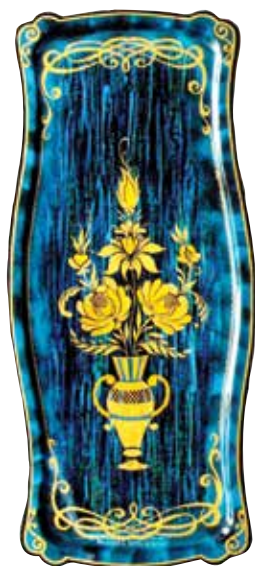
«Розаны в вазе»