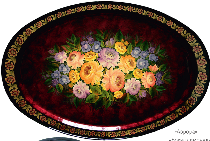
«Аврора» «Бокал лимонада»