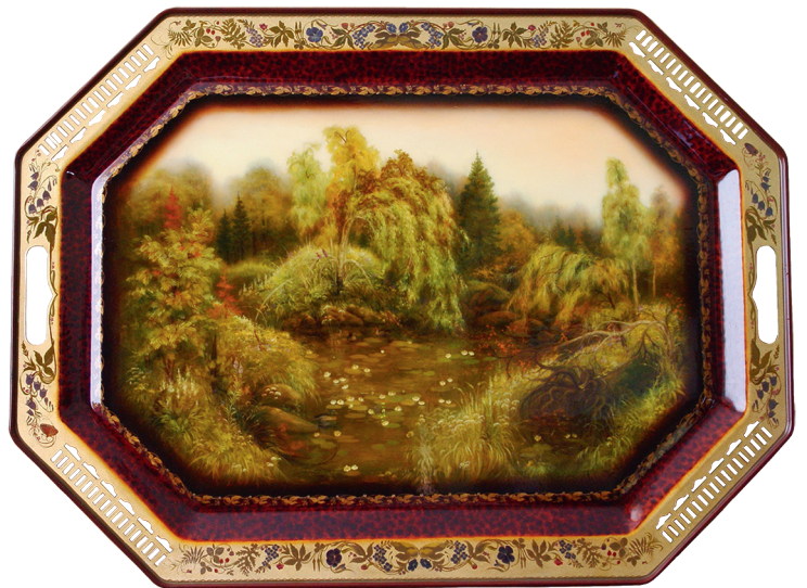
«Река в лесу»

Подносы из собрания Нижнетагильского музея изобразительных искусств