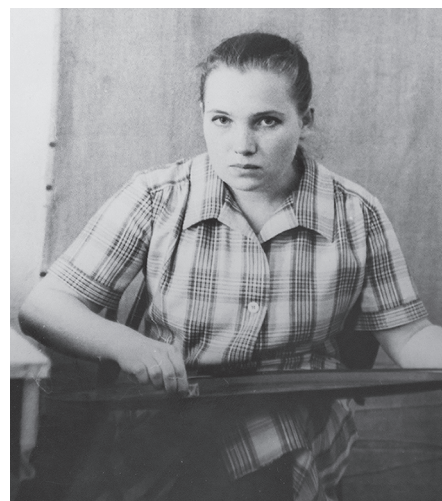
В творческой группе завода Эмальпосуда. 1988