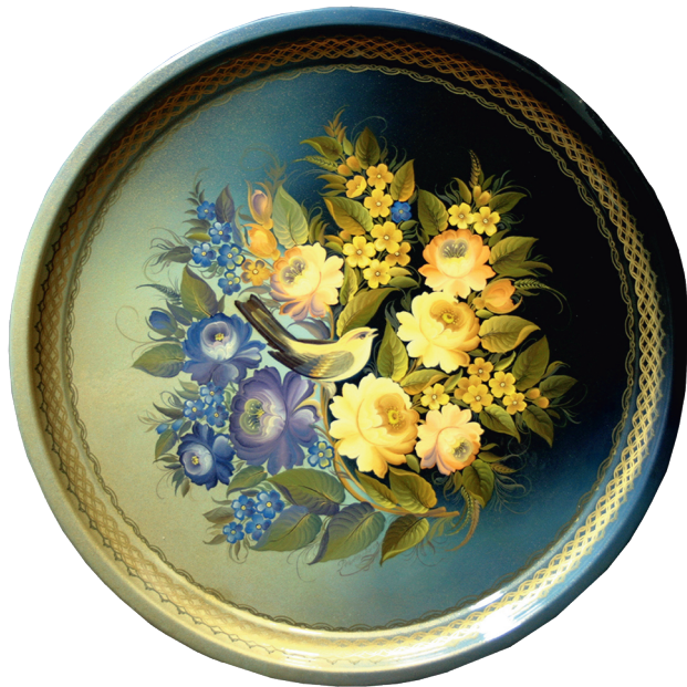
«Птица среди цветов»