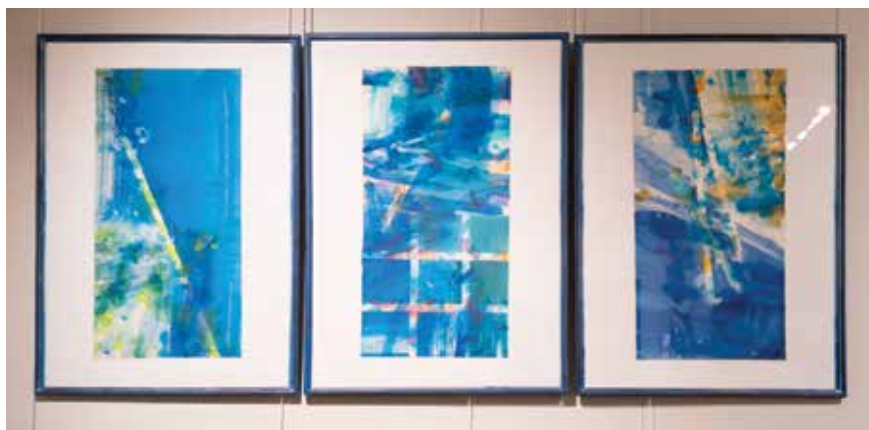
Акварели Ольги Белохоновой-Гайдук

Для многих море ассоциируется не только с отдыхом, но и с темой судоходства, трудовых будней. В таких произведениях – поэтика географических открытий, преодоления путешественниками опасных моментов или покорения морской стихии человеком для использования ее богатств во благо. Не случайно главными «героями» тут стали корабли, технические сооружения, снасти, да и сама портовая жизнь в целом. Эти сюжеты зритель встречает