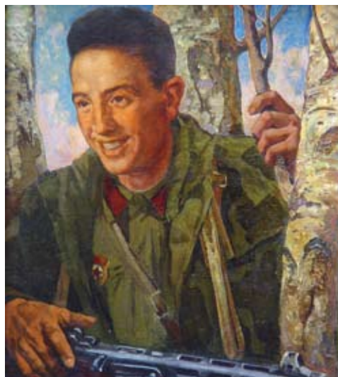
Р. Задорин. Портрет героя Советского Союза Рубена Ибаррури