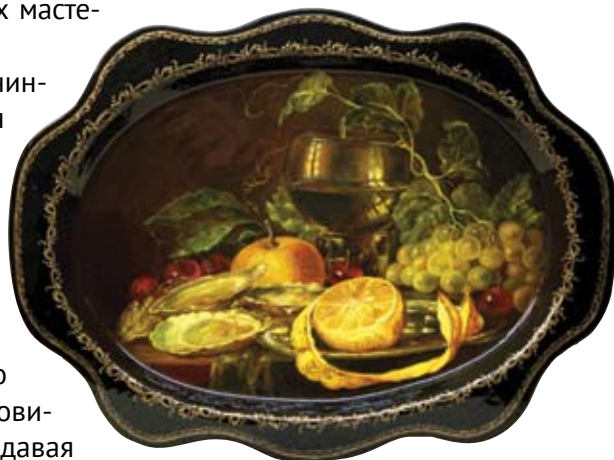
«Десерт». Копия с Корнелиса де Хема