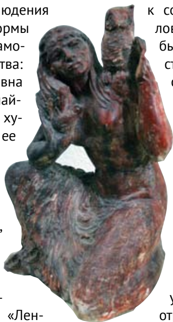
Л. Ушакова. «Река Шайтанка». Эскиз из серии «Реки Урала» 1980-е

В 1980-х одними из лучших в творчестве Ушаковой стали