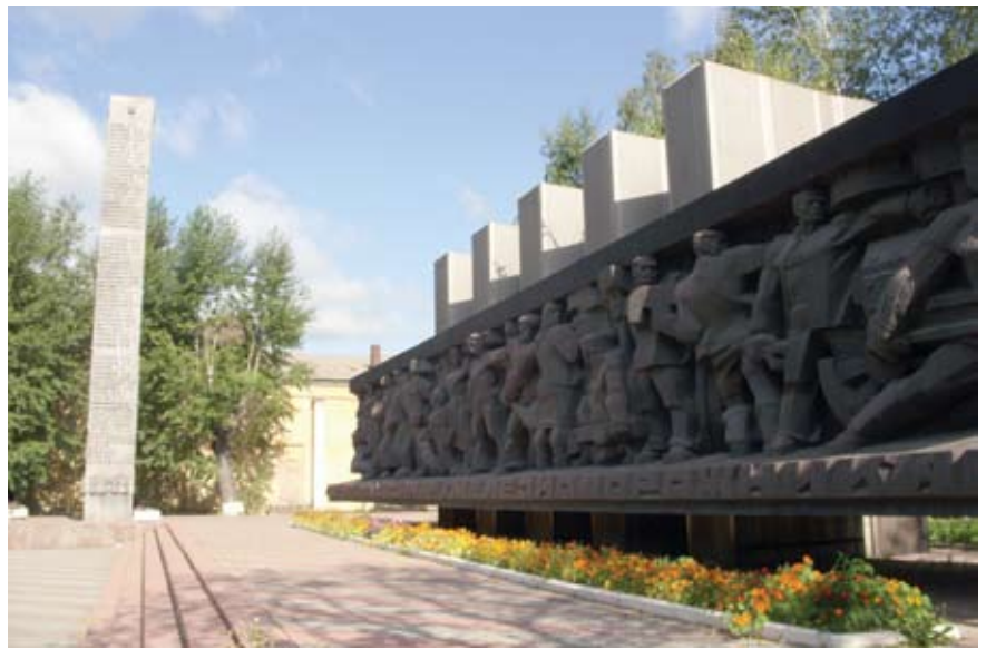
Памятник погибшим железнодорожникам

яний, не только погружающих в наполненную трагическими событиями эпоху войны, но и свидетельствующих о неминуемой Победе. Сила образного решения скульптурной части памятника – в точности найденных стилистических приемов, определяющих суровую выразительность своей лаконичностью, геометризацией, массивностью. Сами фигуры, словно зажатые между рельсов и поражающие нечеловеческой стойкостью и силой, возведены в степень большого символического обобщения. Напряженность внутреннего пространства горельефа оказывается одним из основных элементов, вдохнувших в мемориал энергию. Но автор идет дальше, развивая свою идею: при помощи интенсивной работы светотени горельефа он словно наполняет жизнью образы железнодорожников, соединяя время далекое и сегодняшний день, делает героев прошлого сопричастными современности.