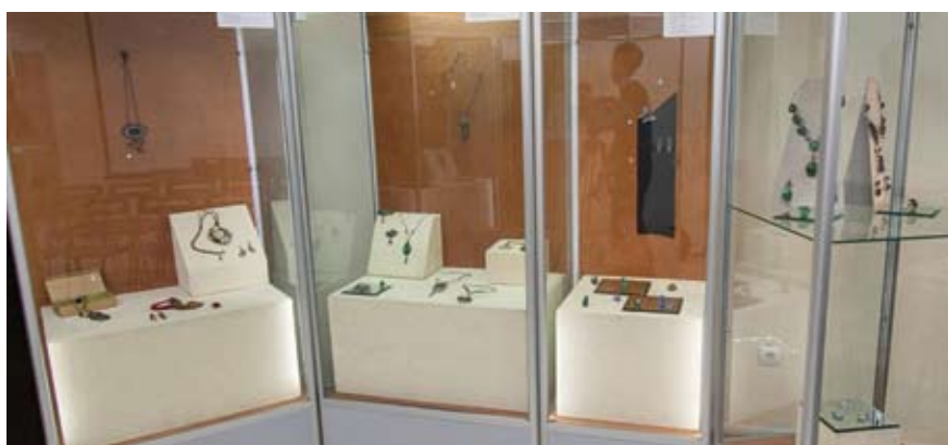
Экспозиция выставки в Нижнем Тагиле

В Нижнетагильском музее изобразительных искусств состоялась выставка тагильских художников-ювелиров. В экспозиции представлена 71 работа десяти авторов. Все произведения в течение лета экспонировались на четвертом всероссийском конкурсе авторского ювелирного и камнерезного искусства в Калининграде в областном музее янтаря, а теперь вернулись в Нижний Тагил и предстали перед уральскими зрителями.