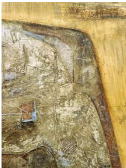
Триптих «Золотой холм» (правая часть)

В своем творчестве Грачиков обращался к самым разным темам, одна из которых периоди-