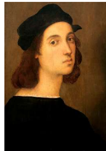
«Автопортрет» Рафаэль Санти, 1504–1506; доска, темпера Галерея Уффици, Флоренция, Италия

Конец XV - начало XVI в. - время, когда искусство Италии переживает свой расцвет. Это период Высокого Возрождения. Рафаэль Санти - одна из самых ярких фигур этого времени. Он родился 6 апреля 1483 года в маленьком городке Урбино, в семье Джованни Санти, придворного художника и поэта герцога Урбинского. Очень рано