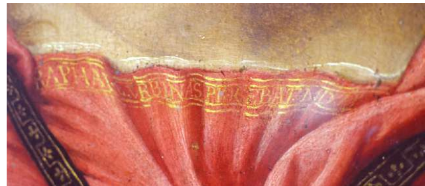
«Святое семейство», фрагмент