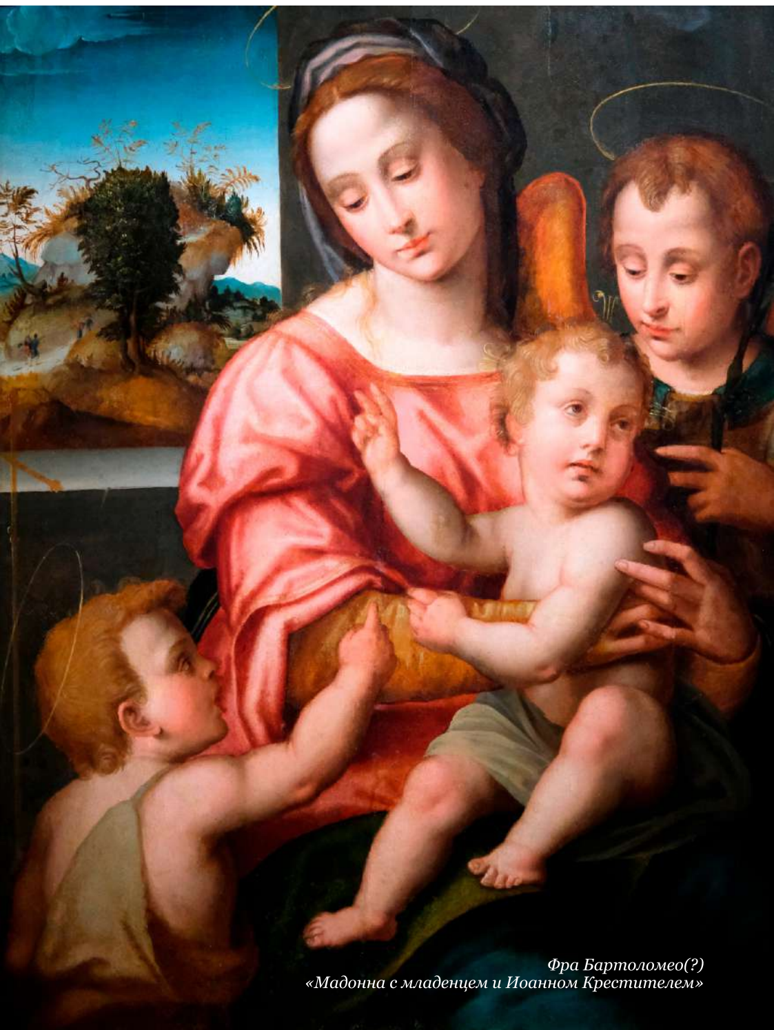
Фра Бартоломео(?) «Мадонна с младенцем и Иоанном Крестителем»

Три другие итальянские «Мадонны» из нашей коллекции относятся также к XVI веку. Самая поэтичная из них и больше всего характеризующая идеалы Высокого Возрождения – это картина неизвестного, но от этого не менее талантливого художника - «Мадонна с младенцем и Иоанном Крестителем». Традиционный сюжет изображения Марии с младенцем Иисусом Христом и Иоанном Крестителем усложняет композицию фигура третьего младенца - ангела. У художников эпохи Высокого Возрождения Мадонна - символ возвышенного и благородного идеала эпохи. Здесь этот образ предельно очеловечен и получил особую жизненную достоверность. «Стилистически и технологически картина похожа на некоторые произведения Фра Бартоломео» 1 . Если это так, то это одна из его ранних вещей характеризующая начало эпохи высокого Возрождения. Положительное влияние на Фра Бартоломео 2 оказал молодой Рафаэль , прибывший в 1504 году во Флоренцию. Оба мастера до конца жизни были связаны узами тесной дружбы.