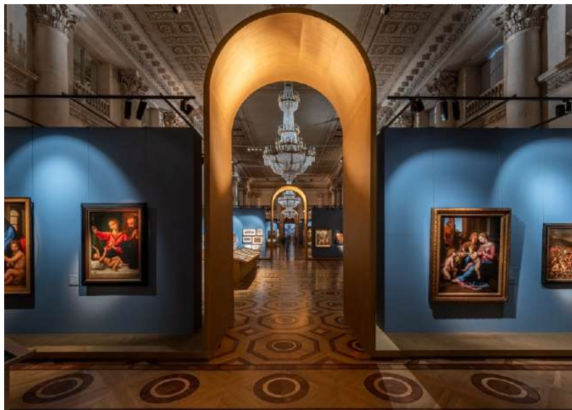
«Святое семейство» на выставке «Линия Рафаэля», Государственный Эрмитаж

нять участие в выставке. Экспозиция «Линия Рафаэля» открылась в декабре 2020. На открытии выставки генеральный директор Государственного Эрмитажа Михаил Пиотровский сказал: «У нас много участников этой выставки - Британский Музей, Альбертино, Лондонская Национальная галерея, Русский музей, Третьяковская галерея, ...частные коллекции и Нижнетагильский музей изобразительных искусств». Поприветствовав Нижнетагильский музей, предоставивший произведение на выставку, М.Б. Пиотровский дал личный комментарий тагильскому шедевру: «И картина совершенно замечательная» 12 .