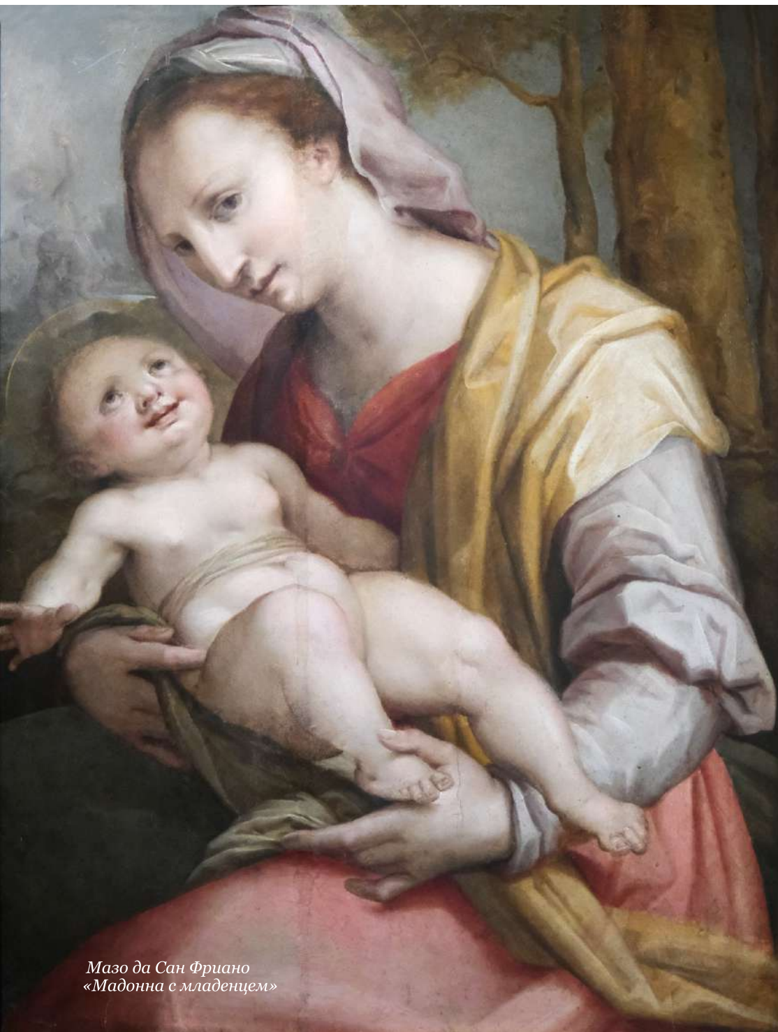
Мазо да Сан Фриано «Мадонна с младенцем»