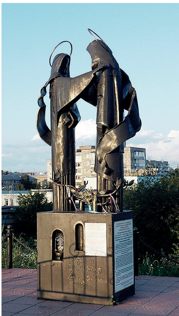
А. И. Иванов. Петр и Феврония. 2009. Металл, сварка. 350×150×100 Нижний Тагил, Красный камень

Все три произведения достаточно уверенно можно отнести к паблик-арту, и в первую очередь по критерию коммуникации работ с окру-